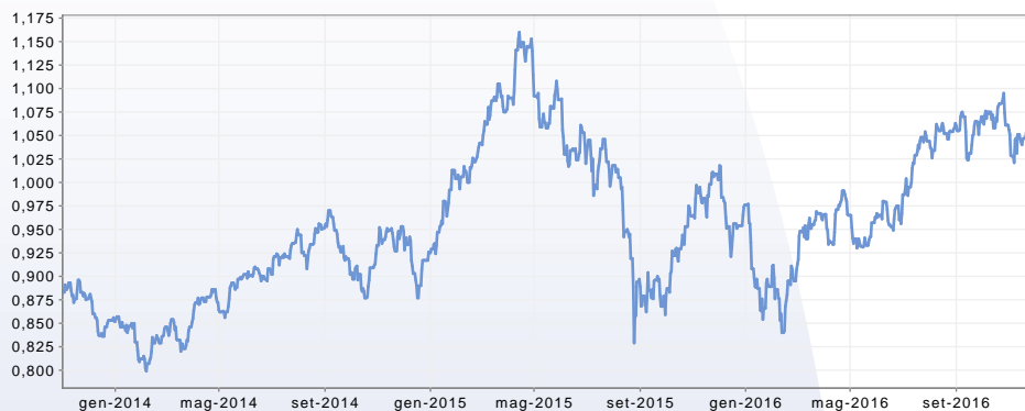
GRAFICO DEL FONDO AL 30/11/2016