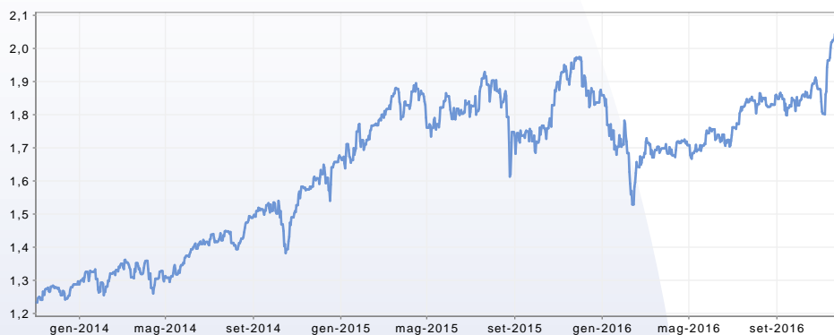
GRAFICO DEL FONDO AL 30/11/2016