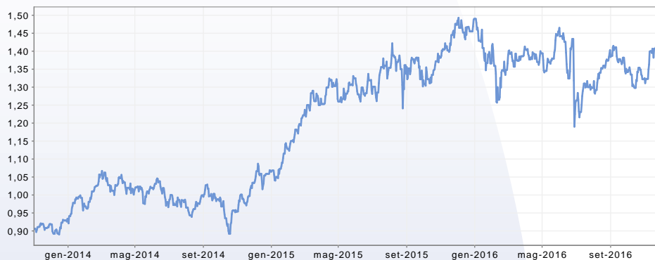
GRAFICO DEL FONDO AL 30/11/2016