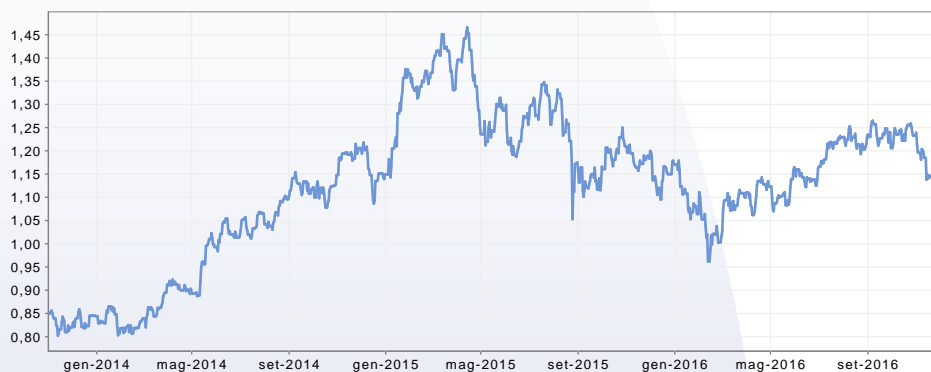
GRAFICO DEL FONDO AL 30/11/2016