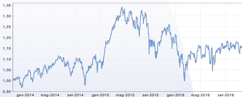
GRAFICO DEL FONDO AL 30/11/2016