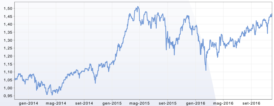
GRAFICO DEL FONDO AL 30/11/2016