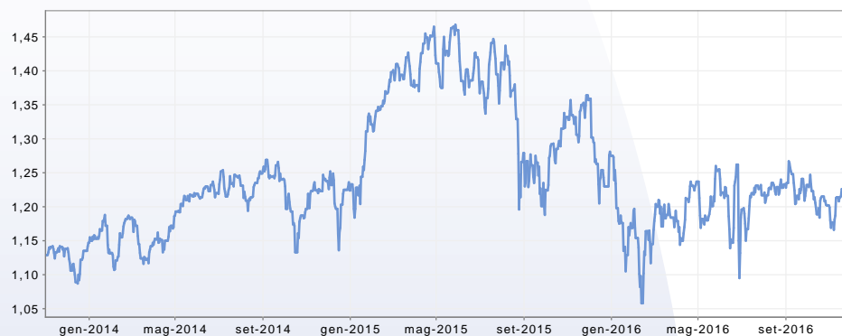
GRAFICO DEL FONDO AL 30/11/2016