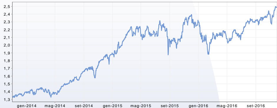
GRAFICO DEL FONDO AL 30/11/2016