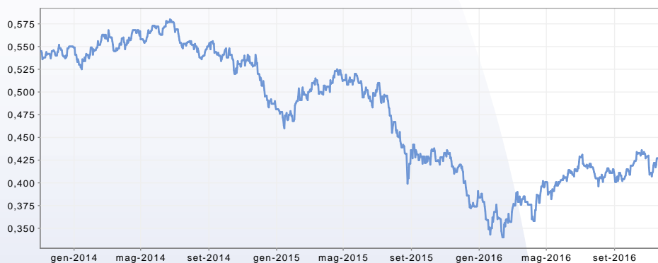
GRAFICO DEL FONDO AL 30/11/2016

Società Zurich Life Assurance plc Sede legale presso Eagle Star House, Blackrock, County Dublin, Irlanda. Zurich Life Assurance plc è una società del Gruppo Zurich soggetta alla vigilanza dell'Irish Financial Regulator. Sito web www.zurich-irlanda.it Numero verde 800 871 263