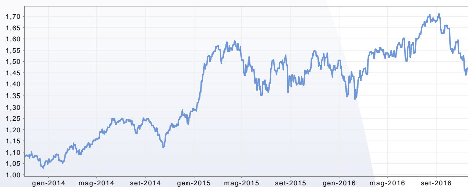
GRAFICO DEL FONDO AL 30/11/2016