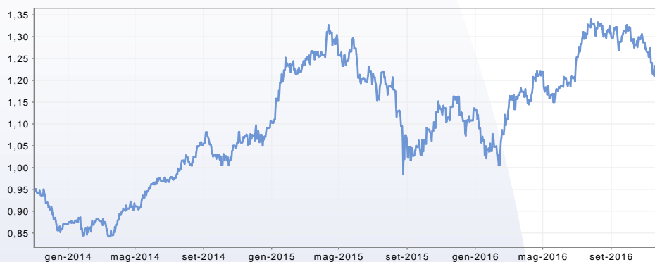
GRAFICO DEL FONDO AL 30/11/2016