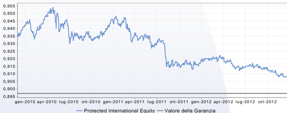
GRAFICO DEL FONDO AL 06/12/2012

Società Zurich Life Assurance plc Sede legale presso Eagle Star House, Blackrock, County Dublin, Irlanda. Zurich Life Assurance plc è una società del Gruppo Zurich soggetta alla vigilanza dell'Irish Financial Regulator. Sito web www.zurich-irlanda.it Numero verde 800 871 263