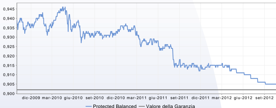
GRAFICO DEL FONDO AL 02/10/2012

Società Zurich Life Assurance plc Sede legale presso Eagle Star House, Blackrock, County Dublin, Irlanda. Zurich Life Assurance plc è una società del Gruppo Zurich soggetta alla vigilanza dell'Irish Financial Regulator. Sito web www.zurich-irlanda.it Numero verde 800 871 263